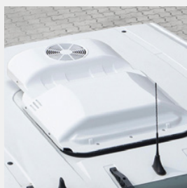
Climatisations de toit Cooltronic d'origine MAN

Personnalisez votre véhicule avec les accessoires d'origine MAN et augmentez ainsi votre sécurité et votre confort.