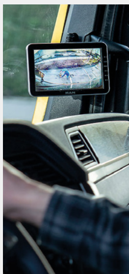
Systèmes d'assistance à la conduite d'origine MAN:

système de caméra 360° BirdView, assistant de changement de direction, système de caméra latérale.