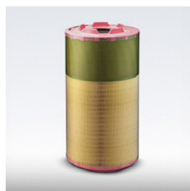
Natte filtrante d'origine MAN