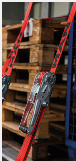
Sangle de serrage d'origine MAN