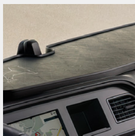
Plateau d'origine MAN