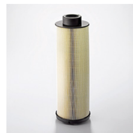
Filtres à air d'origine MAN