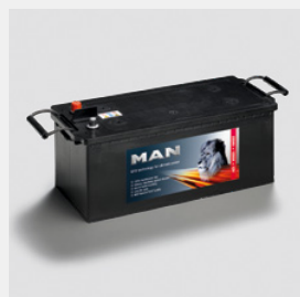
Batteries d'origine MAN

Les batteries d'origine MAN se distinguent par leur technologie Powerframe innovante. Elles sont la solution parfaite pour une efficacité, une fiabilité et une durabilité maximales.