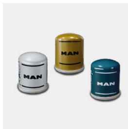
Cartouches pour sécheur d'air d'origine MAN

Empêchent de manière fiable la corrosion à l'intérieur du système d'air comprimé.