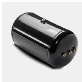
Réservoir d'air comprimé d'origine MAN

Pièces d'origine MAN du groupe de produits Air – parce que l'original est plus efficace.