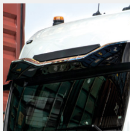
Pare-soleil au design optimisé sur le plan aérodynamique d'origine MAN

système de caméra 360° BirdView, assistant de changement de direction, système de caméra latérale.