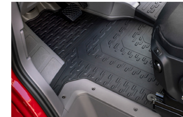
Tapis de sol pour tous les temps TGE d'origine MAN