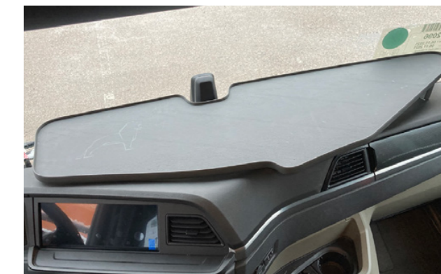
Plateau d'origine MAN