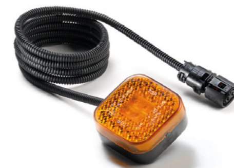
Feux de position latéraux d'origine MAN