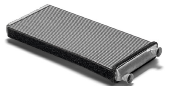
Radiateur d'origine MAN