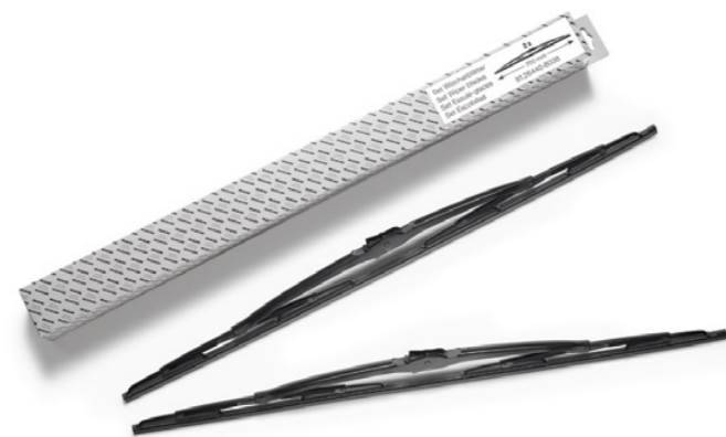
Balais d'essuie-glace d'origine MAN