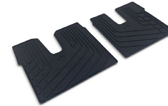
Tapis de sol pour tous les temps pour poids lourds d'origine MAN