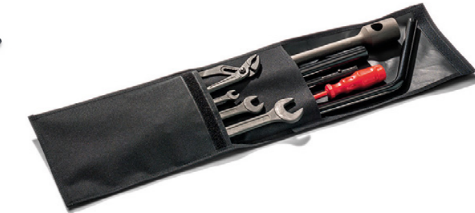
Rangement d'outils d'origine MAN