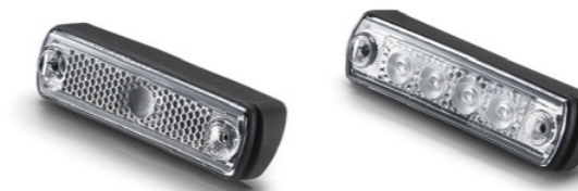
Feux de position d'origine MAN