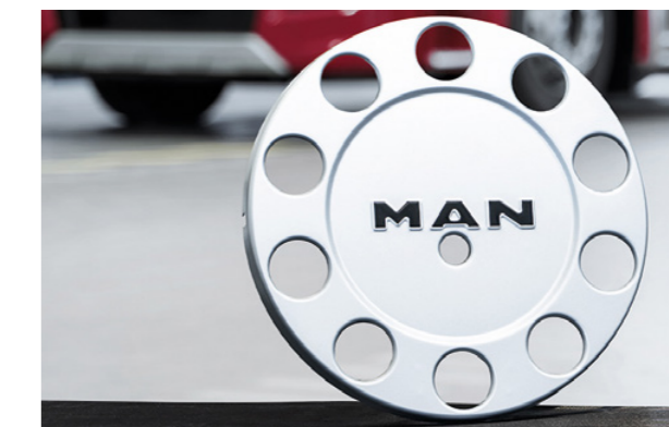
Enjoliveur de roue d'origine MAN