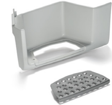
Pièces d'origine MAN pour l'accès