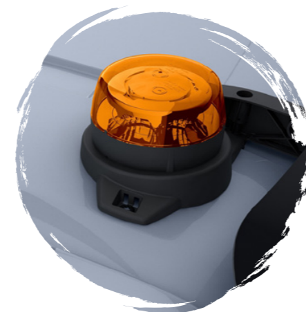
Gyrophares à LED d'origine MAN