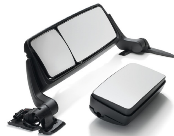
Rétroviseur extérieur d'origine MAN