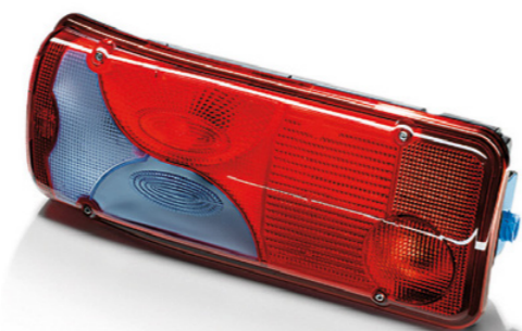
Feux arrière d'origine MAN