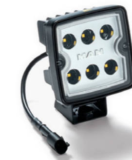
Projecteurs de travail LED d'origine MAN