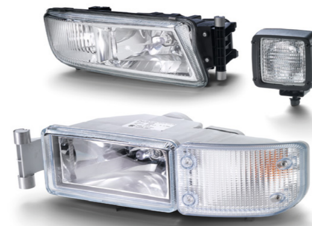
Feu longue-portée supplémentaire d'origine MAN