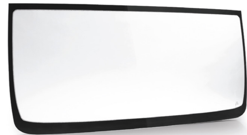
Pare-brise d'origine MAN