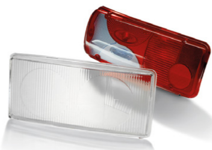
Vitre et diffuseur pour feux d'origine MAN