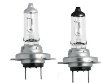
Ampoules d'origine MAN Egalement disponible dans la boîte à ampoules pratique.