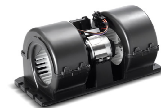
Ventilateurs d'origine MAN