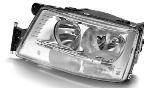
Phares d'origine MAN