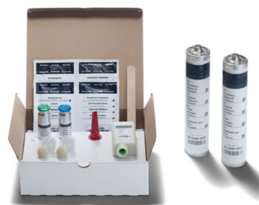
Kit de collage pour vitres d'origine MAN