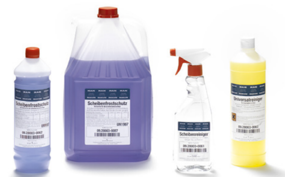
Nettoyant vitres d'origine MAN